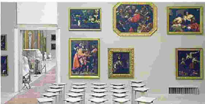
Il nuovo allestimento della Galleria Estense prevede l'esposizione di oltre trecento dipinti e sculture provenienti dai magazzini nelle sale del Palazzo Ducale di Sassuolo che diventa parte integrante del museo, promosso a ente autonomo